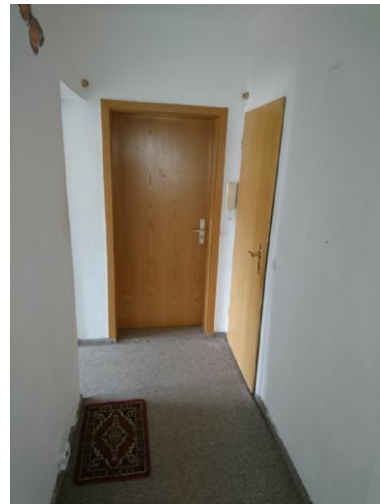
Flur u. Wohnungstür