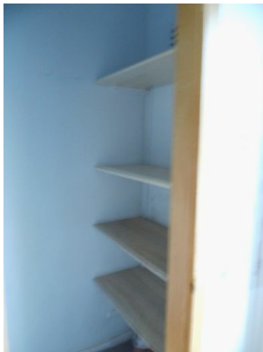
Blick i.d.Kammer n.d. Küche