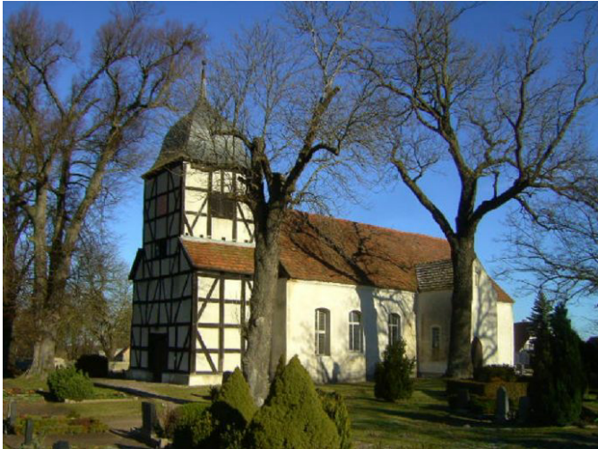
Die Kirche im Ort