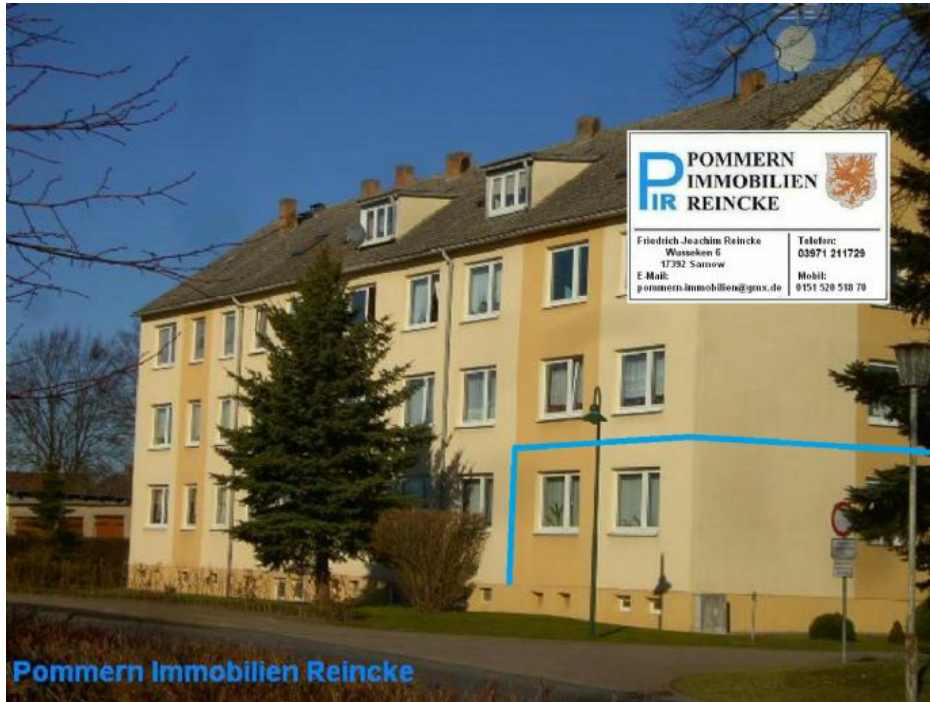
Pommern Immobilien Reincke