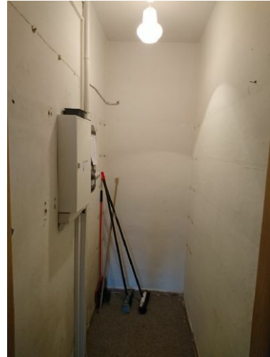
Kammer im Flur