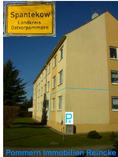
Vor dem Objekt !!