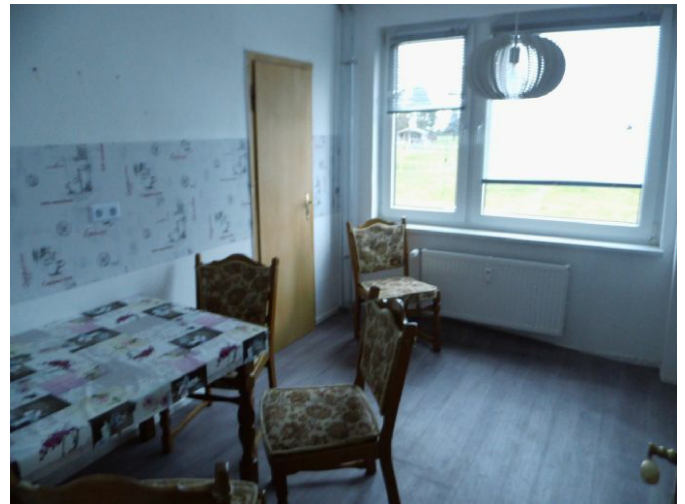
Küche Tür z. Kammer