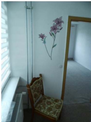
Blick in den Flur