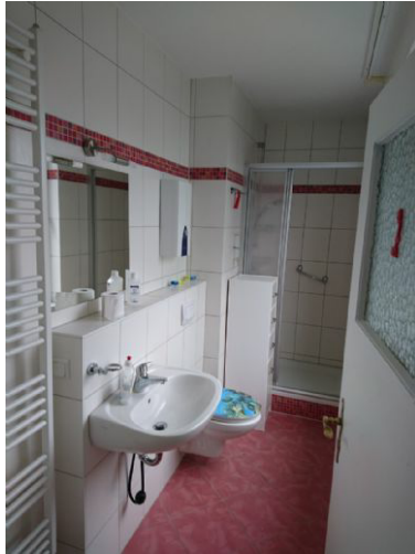
Blick ins Bad