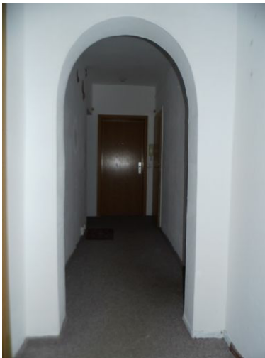
Flur Blick z. Eingangstür