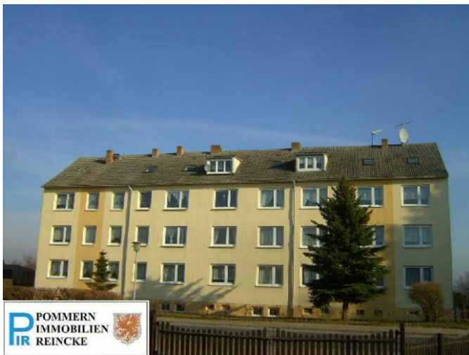
Das Haus !