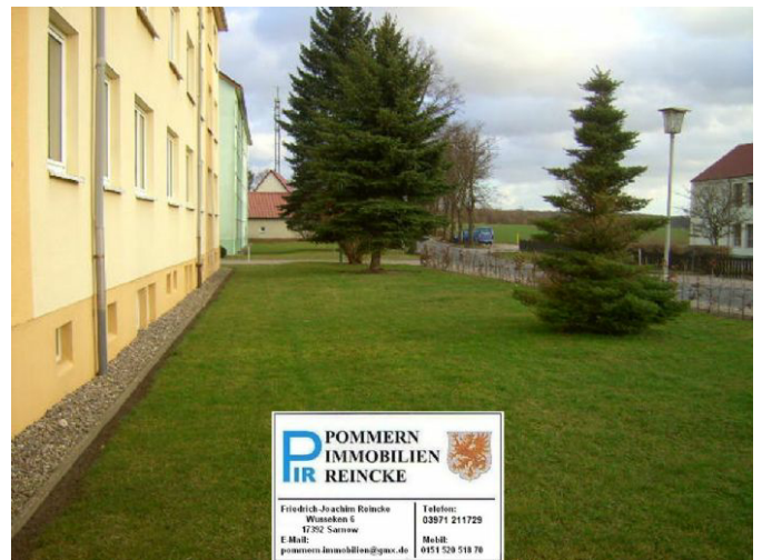
Vor dem Haus!