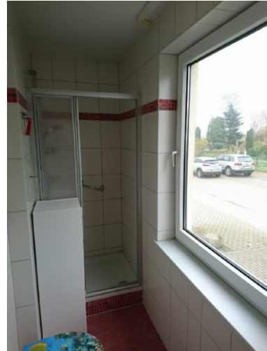
Bad m. großem Fenster