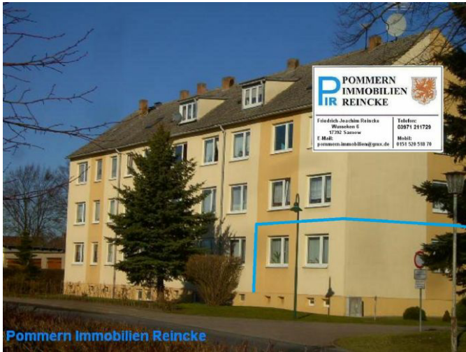
Das Haus am Ortsrand !!!