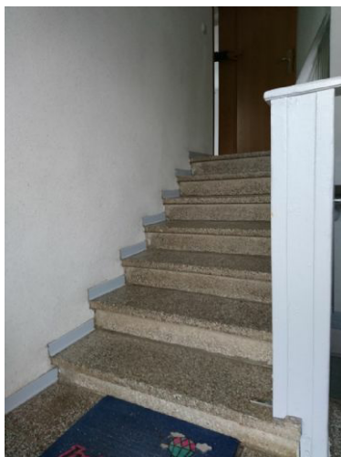
Treppe zur Whg.